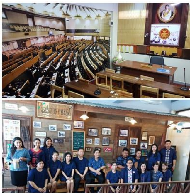
ภาพที่ 4 ศูนย์การเรียนรู้ประชาธิปไตย โรงเรียนบ้านปล่องเหล็ก