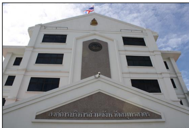
ภาพที่ 2 สำนักงานองค์การบริหารส่วนจังหวัดสมุทรสาคร

สมุทรสาคร มีบุคลากรรวมทั้งสิ้น 250 คน ผลการประเมินประสิทธิภาพขององค์กรปกครองส่วนท้องถิ่น (Local Performance Assessment: LPA) ปี พ.ศ. 2564 ได้คะแนน 91.94 ผ่านในระดับดีเด่น และผลการประเมินคุณธรรมและความโปร่งใสในการดำเนินงานของหน่วยงานภาครัฐ (ITA) พ.ศ. 2564 ได้คะแนน 98.60